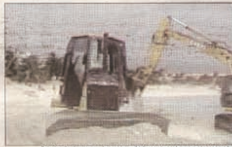
Con las imágenes más que reveladoras, los infames actos ecocidas quedaron al desnudo.

reveladoras, los infames actos ecocidas quedaron al desnudo, están destruyendo los ecosistemas protegidos, ese delito -así se tipifica en el código Penal- se comete ante los ojos de la ciudadanía, el presidente municipal, el gobernador del Es-