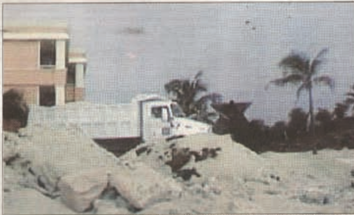
A pesar de las evidencias y las denuncias, el grupo sigue haciendo en las costas.