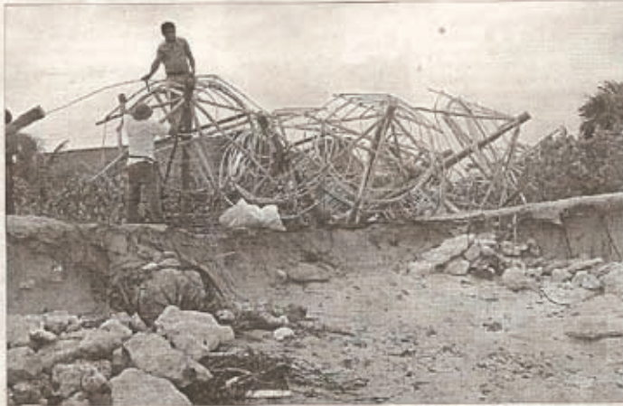
DETALLES. Empleados del Bahía Principe preparan las sombrillas para colocarse en las playas.

En ese sentido, la delegada aseguró que se seguirá trabajando con la empresa. Y que se van a realizar en los casos que sea necesario, todos los procedimientos contra cualquier que viole las reglas y afecte la ecología. No es el único lugar donde los grupos ecologistas han entablado denuncias por depredación, contra el manglar por cambio ilegal de uso de suelo de una zona forestal, así como por sobreexplotación.