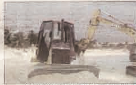
Con las imágenes más que reveladoras, los crímenes ecocidas quedaron al descubierto.

reveladoras, los infames actos ecocidas quedaron al descubierto, están destruyendo los ecosistemas protegidos, así se aplica en el código Penal, se comete ante los ojos de la ciudadanía, el presidente municipal, el gobernador del Es