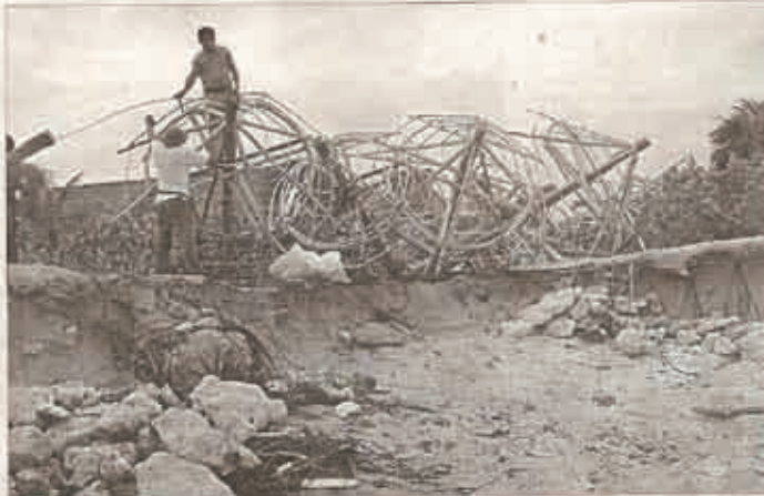
DETALLES. Empleados del Bahía Príncipe preparan las suntuillas para colocarlas en las playas.

En ese sentido, la delegada aseguró que se tomará tiempo en la empresa. Y que se van a realizar en los casos que sea necesario, todos los procedimientos contra cualquier que violente las reglas y afecte la ecología. No es el único lugar donde los grupos ecologistas han entablado denuncias por degradación, contra el manejo por cambio ilegal de uso de suelo de una zona forestal, así como por sobredensificación.