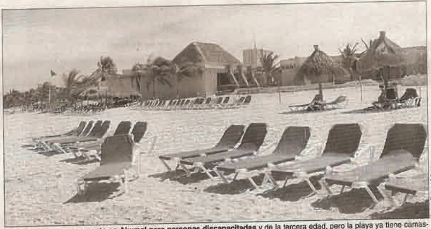
El DIF creó un campamento en Akumal para personas discapacitadas y de la tercera edad, pero la playa ya tiene camastros de Bahía Príncipe.

Los integrantes del Grupo Salvamento y Vida Ecológica de Akumal, denuncian que el Grupo Piñero, operador del Complejo Turístico Gran Bahía Príncipe, en cuyas instalaciones los trabajos de relleno de mar y playas ya fueron clausurados ayer por la mañana por la Profepa, de acuerdo a información oficial de la dependencia, amparados en un convenio firmado con el DIF y la Asociación Flora, Fauna y Cultura de México, además que con la Fundación Bahía Príncipe, la poderosa cadena Bahía Príncipe poco a