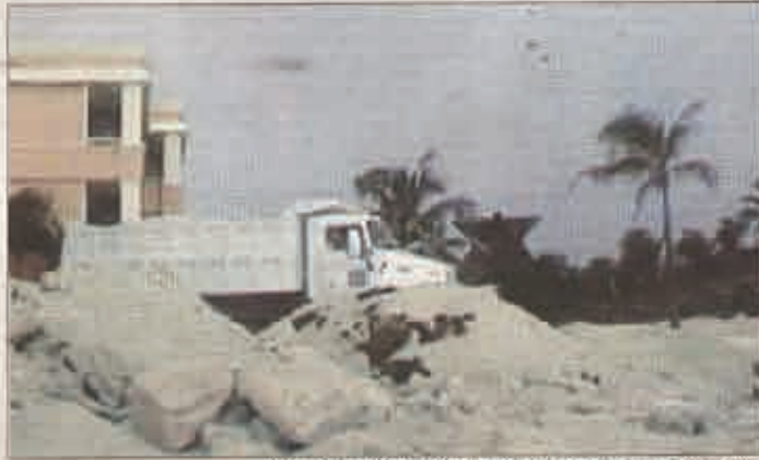
A pesar de las evidencias y las denuncias, el grupo sigue haciendo en las playas.